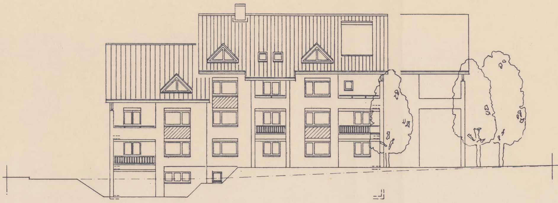
HAUS 1 WEST FASSADE