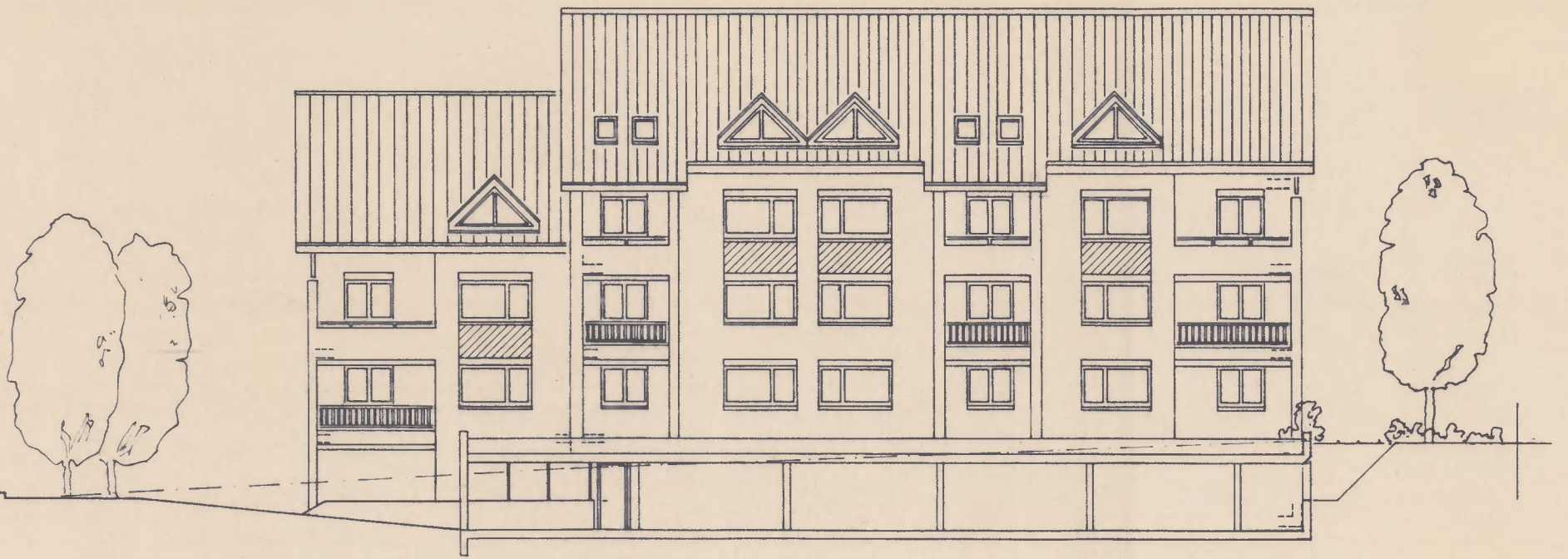
HAUS 2 WEST FASSADE